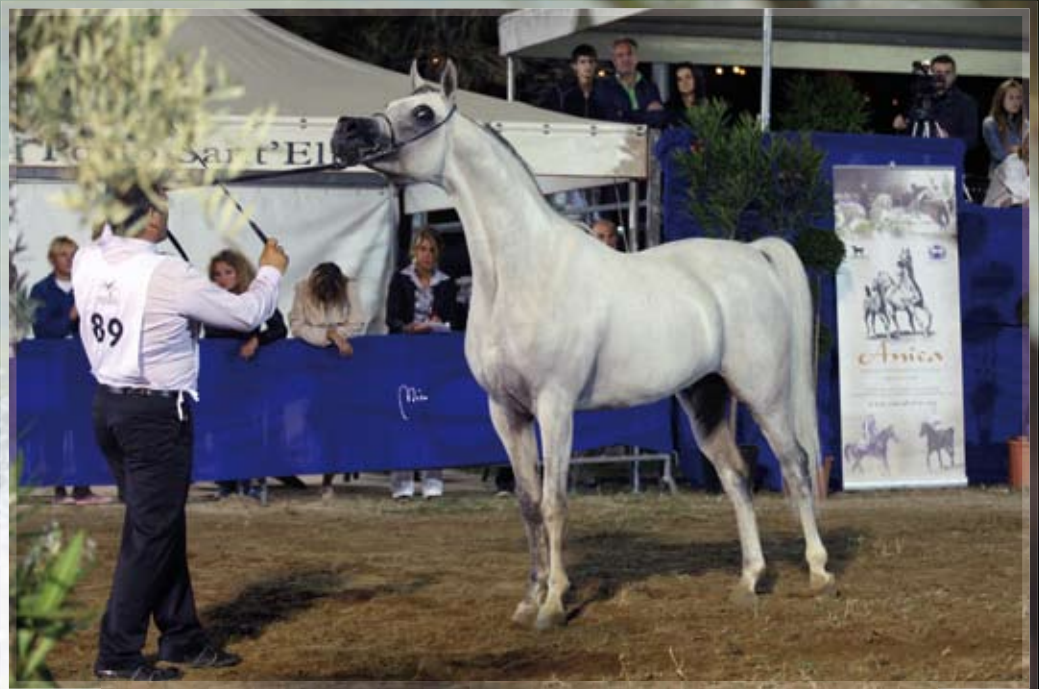
Bronze WARES (Piruet X Wenera) owned by Groane